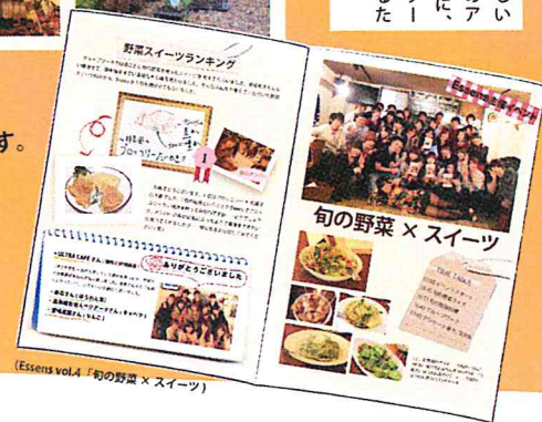
(Essens vol.4 「旬の野菜 × スイーツ」)